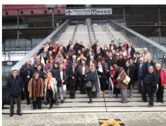
Rencontres nationales des Conseils de développement 24 & 25 nov à Plaine Commune

Le conseil était également présent à la Journée d'information sur le FEAMP à La Forêt-Fouesnant, le 23 avril 2014.