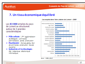
L'emploi et l'économie dans le Pays de Lorient en 22 résultats